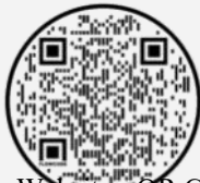
Website - QR Code

“Y la Iglesia debe estar siempre edificando, y siempre decayendo, y siempre restaurándose”. T.S. Eliot