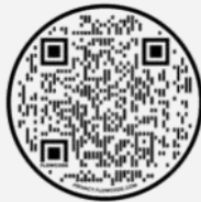
Website - QR Code

“Y la Iglesia debe estar siempre edificando, y siempre decayendo, y siempre restaurándose”. T.S. Eliot